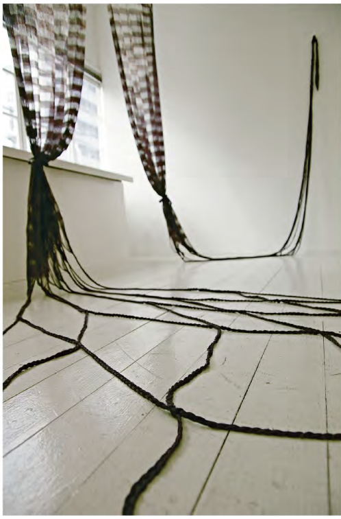
(彼女の見つめる風景) 2008年

1976年大阪府生まれ。 現在、日本とオーストラリアを拠点に活動。 2012年京都市立芸術大学美術研究科博士課程研究領域染織 修了 博士(美術) 近年の主な展覧会：2018年「東アジア文化都市2018金沢 変容する家」金沢市内各所(石川)、2017-2018年「交わるいと」『あいだ』をひろく術として「広島市現代美術館(広島)、2017年「―仮想の島― grandmother island 第一章」 MATSUO MEGUMI+VOICE GALLERY pls.w (京都)ほか